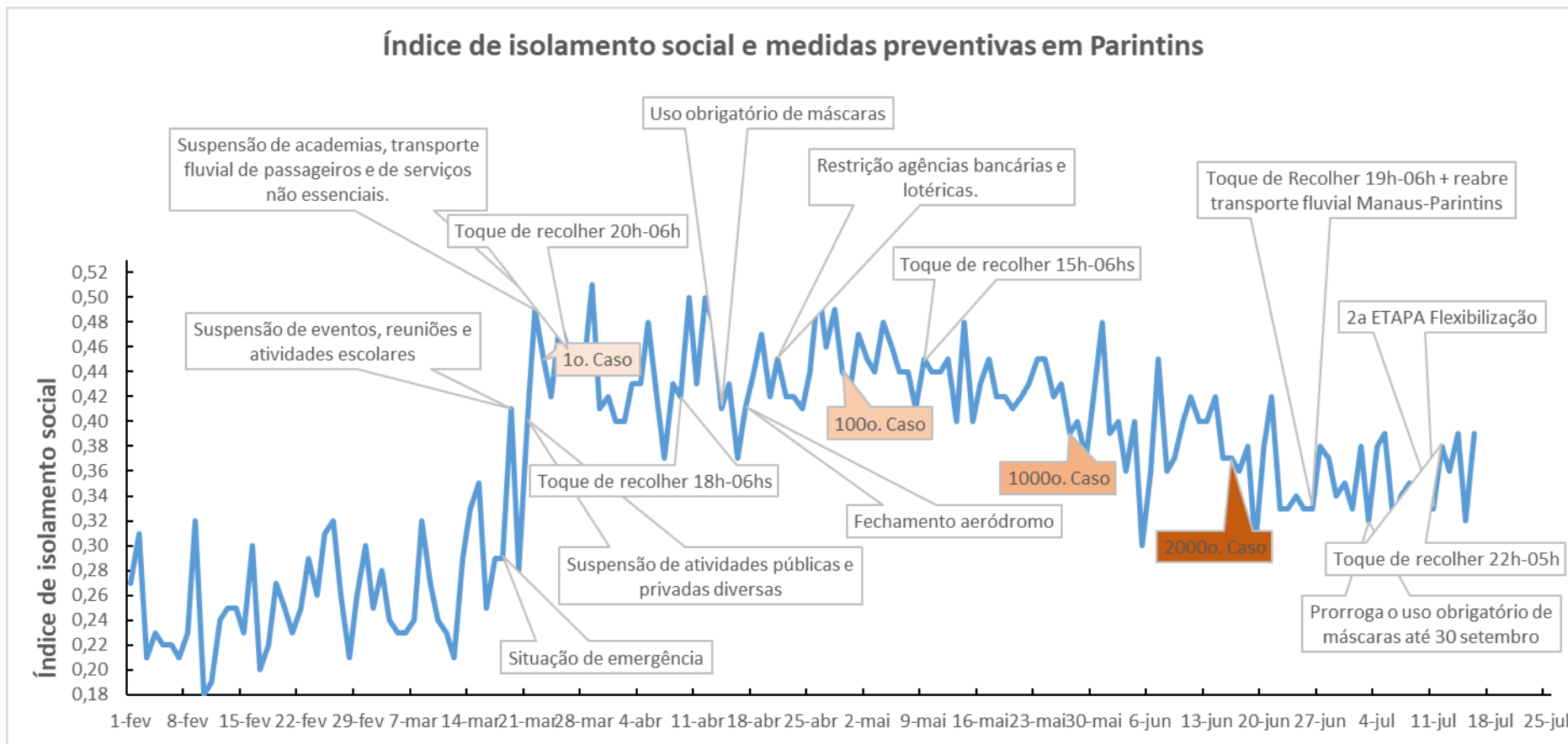
Figura 3 Índice de isolamento social e datas de decretos municipais com medidas preventivas para o controle da pandemia de Covid-19 no Município de Parintins.