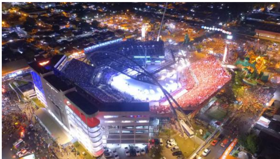
Figura 4 Imagem aérea do bumbódromo de Parintins durante o festival.

No bumbódromo, onde a festa acontece, mais de 20 mil 2 pessoas concentram-se nas arquibancadas. A aglomeração também acontece fora, já que diversos bares recebem os visitantes que aguardam a abertura dos portões.